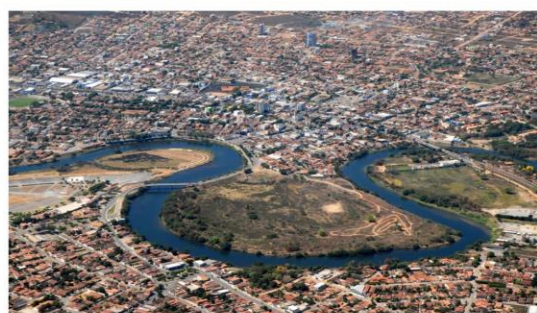
Rio grande cortando a cidade Barreiras-BA