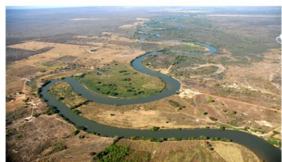
Meandros do Rio Grande, na qual há pouca mata ciliar.