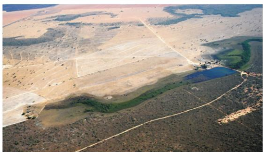
Nascente do Rio Grande, Serra Geral do Goiás, município de São Desidério-Ba.