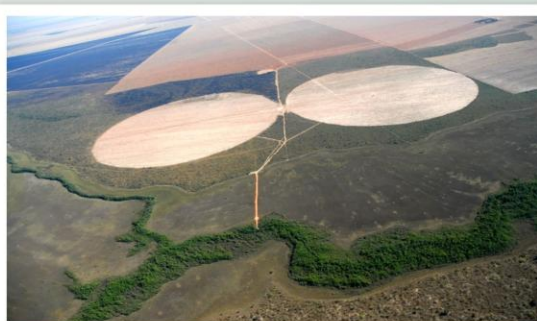
Preparação de pivôs. A expansão agrícola favorece o assoreamento do rio.

·Os estudos demonstraram que a atual situação do Rio Grande é degradante em virtude do desmatamento da vegetação ciliar as suas margens, provenientes da expansão urbano-agrícola em longo prazo.